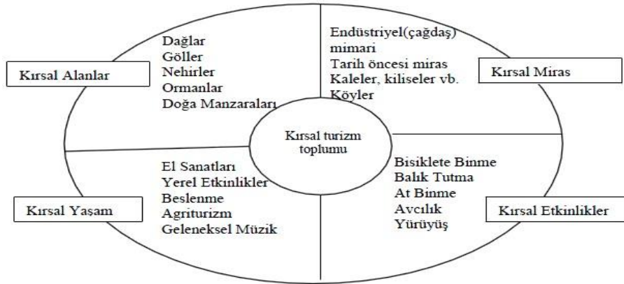
Şekil: 1. Kırsal Turizm Kavramı (Kırsal Turizm Bileşenleri)

Kırsal alanlarda ortaya çıkan bir turizm çeşidi olarak kırsal turizm çok yönlü ve kompleks bir aktivitedir. Kırsal turizm, çiftlik turizmi, yeşil turizm veya yayla turizmi olmakla birlikte, doğa tatillerini ve özellikle de eko turizm, alışveriş, kayak, bisikletli ve atlı doğa gezileri, macera, rafting, spor, termal turizm, avcılık ve balıkçılık, sanat, tarih ve etnik yapıya endeksli bir turizm çeşididir. Kırsal turizmi kavram olarak daha iyi bir şekilde anlayabilmek için, onu oluşturan bileşenleri bilmek oldukça önemlidir. Ek1'deki şekil bunu açıklamaktadır (Çeken ve diğerleri, 2007: 7).